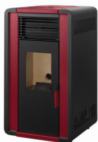
ii) e iiiii)

i) Branco/ Blanco/ White/ Blanc/ Bianco - ii) Bordeaux/ Burdeos/ Bordeaux/ Bordò - iii) Cinza/ Gris/ Grey/ Gris/ Grigio - iiii) Preto/ Negro/ Black/ Noir/ Nero - iiiii) Carvalho/ Roble/ Oak/ Chêne/ Quercia