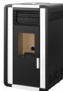
i) e iiiii)