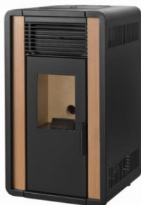
iiii) e iiiii)