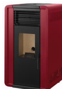
ii) e iiiii)