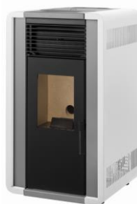
i) e iiiii)