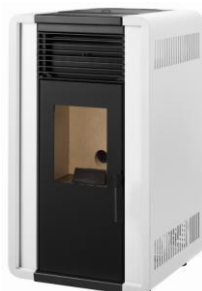
i) e iiiii)