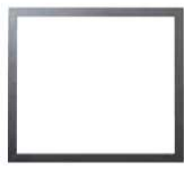
4 LADOS - 25mm