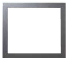
4 LADOS - 50mm