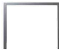
3 LADOS - 25mm